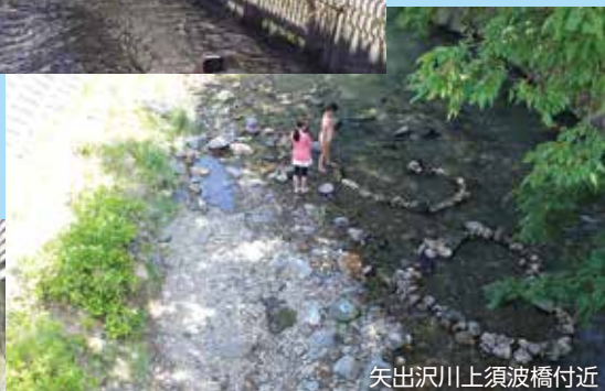
矢出沢川上須波橋付近