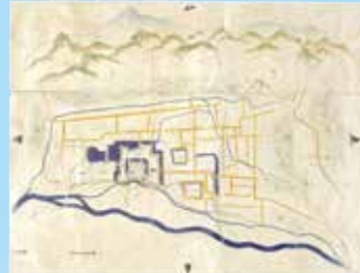
正保の城絵図 (国立公文書館蔵)