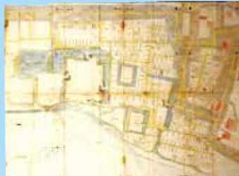
安政年間上田城下町絵図